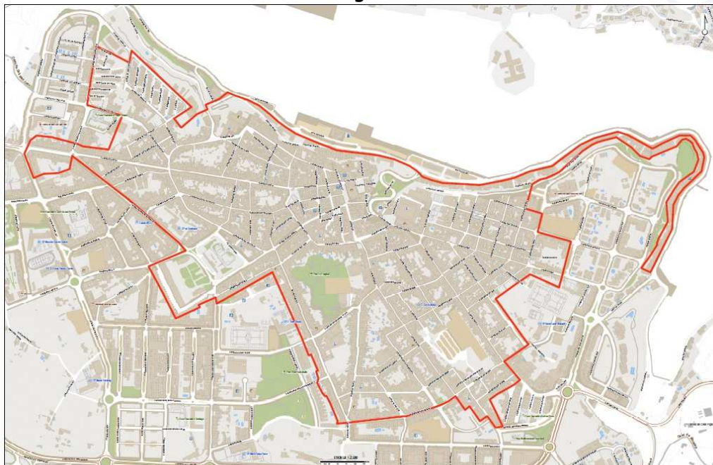
ARRU - ÀREA DE REGENERACIÓ I RENOVACIÓ URBANA DE MAÓ